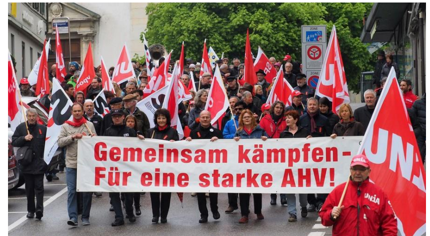
Gewerkschaftsbund Kanton Solothurn GbS